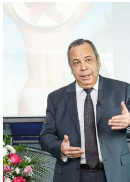
«Как врач, всем свои пациентам я рекомендую брать в аптеке только препараты, отвечающие стандартам GMP».