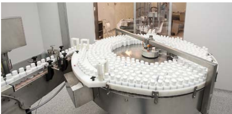
GMP — это своеобразный знак высшего признания среди производителей лекарственных препаратов и биологически активных добавок. Качество, а значит эффективность продукции, гарантировано строгим соблюдением надлежащей производственной практики, так называемого международного стандарта GMP.

определить причину своей зависимости к сладкому и легко избавиться от нее. К примеру, что из сладкого вы выбираете? Если предпочитаете шоколад, то вашему организму не хватает магния. Любите пирожное? Наверняка у вас дефицит триптофана.