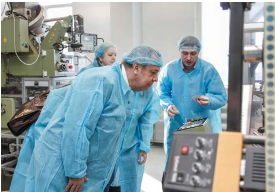
На автоматизированной чаеразвесочной линии каждый фильтр-пакет индивидуально упаковывается в многослойный защитный конверт, чтобы сохранить тонкий вкус и аромат травяного чая.